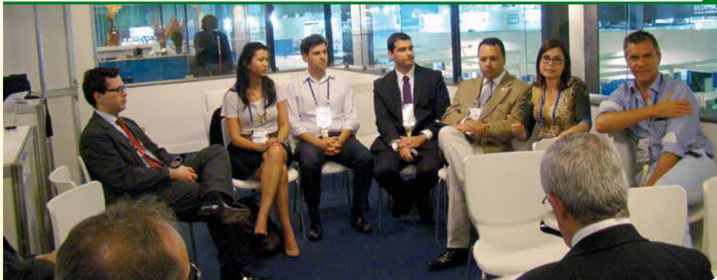
Reunião da Comissão CBO Jovem no último congresso do CBO