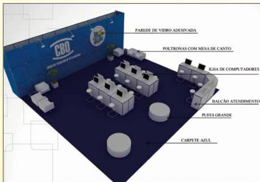
Projeto do Estande do CBO no congresso

A Exposição Comercial do Congresso CBO 2014 terá uma área total de mais de 2.500 m 2 e contará com a participação de mais de 70 empresas do segmento oftálmico. Além disso, haverá várias entidades e associações ligadas à Oftalmologia e à Saúde Ocular que estarão presentes na