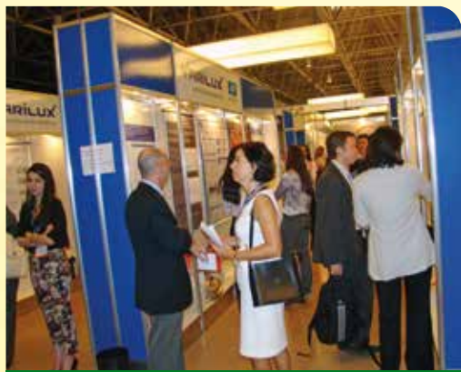
Visão do "Encontro com o Autor" do último congresso do CBO

Como vem acontecendo nos congressos promovidos pelo CBO, haverá a Sessão Encontro com o Autor na manhã de 04 de setembro. Nessa sessão, os primeiros autores dos trabalhos apresentados na forma de pôster estarão na praça científica e seus trabalhos serão avaliados por professores especialistas no tema apresentado e debatidos com os presentes.